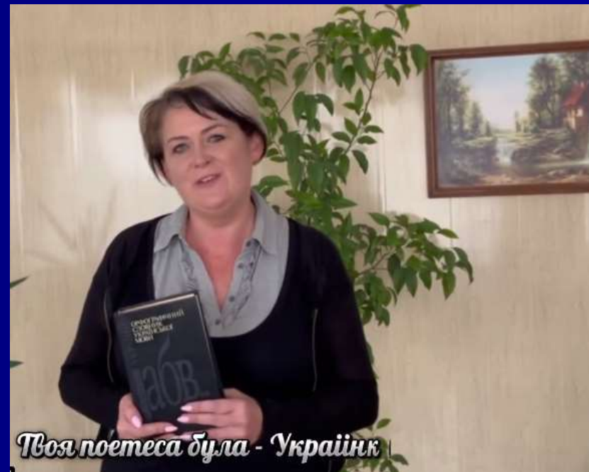
Твоя поетеса була - Українк!